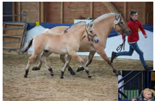
Raband v. Reidar van den Bosdries