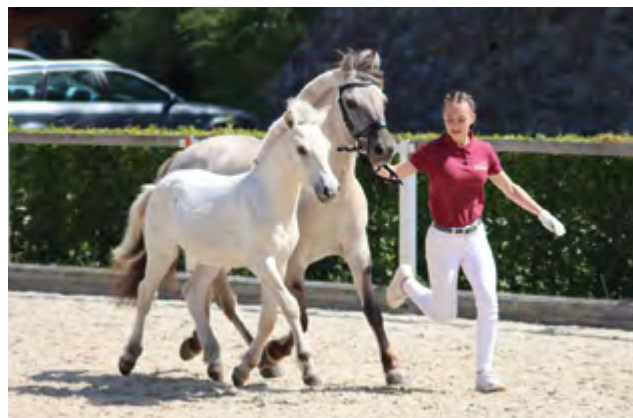
Rubeus Note 8,11