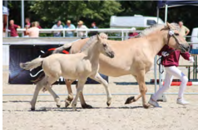
Reykur Note 8,50