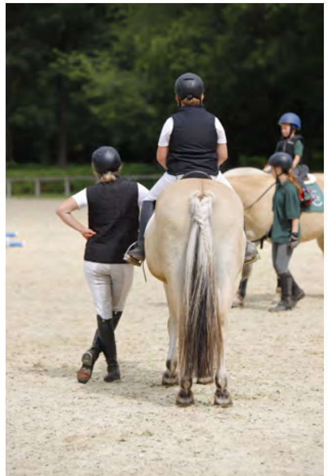
Fjordcup 2022 in Bad Segeberg