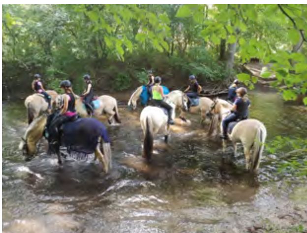
Jugendcamp 2022 in Bad Segeberg