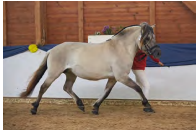
Felina v. Ilmar

Auch für ältere Stuten kann der Sammeltermin des Pony- und Pferdezuchtverbandes Hessen genutzt werden. Die noch nicht eingetragenen Stuten mit Fohlen bei Fuß werden bei dieser Gelegenheit gerne ins Zuchtbuch aufgenommen.