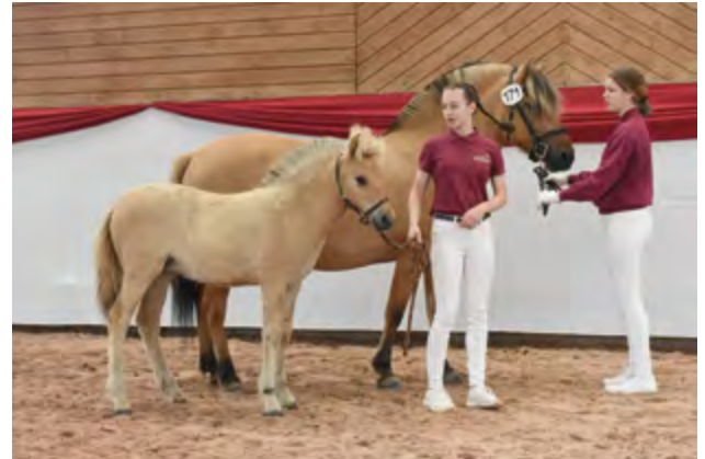
Soraya vom Zwergental, Züchter Rebecca Saft