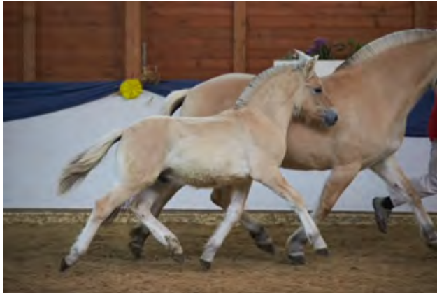
Dartagnan v. Dylano

wurden 37 prämiert (Vorjahr: 26/15). Insgesamt 33 Stuten wurden eingetragen (Vorjahr: 24 davor 19), und von den Drei- und Vierjährigen wurden 14 Stuten prämiert. Mit einer Eintragungsnote von 7,5 und besser haben diese die erste Voraussetzung für die Auszeichnung als Prämienstute erfüllt.