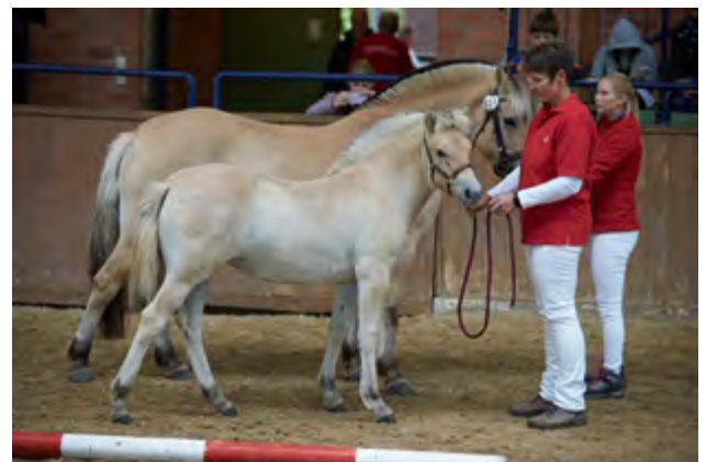
Luna v. Kalino