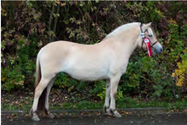
Leska v. Fjelltuvas Søljar

im Sommer antreten konnten, haben hier eine Chance, ebenso drei -und vierjährige Stuten, die für die Anwartschaft auf den Prämientitel in Frage kommen.