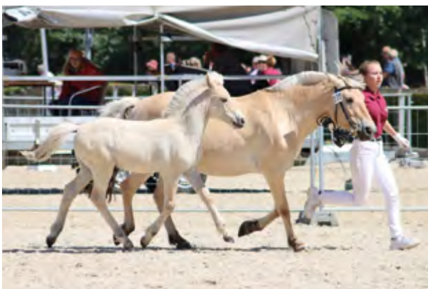
Skölmir Note 8,67