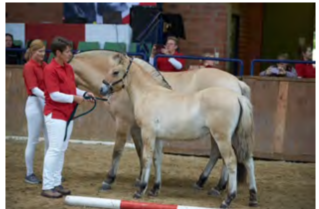
Harriet v. Kalino